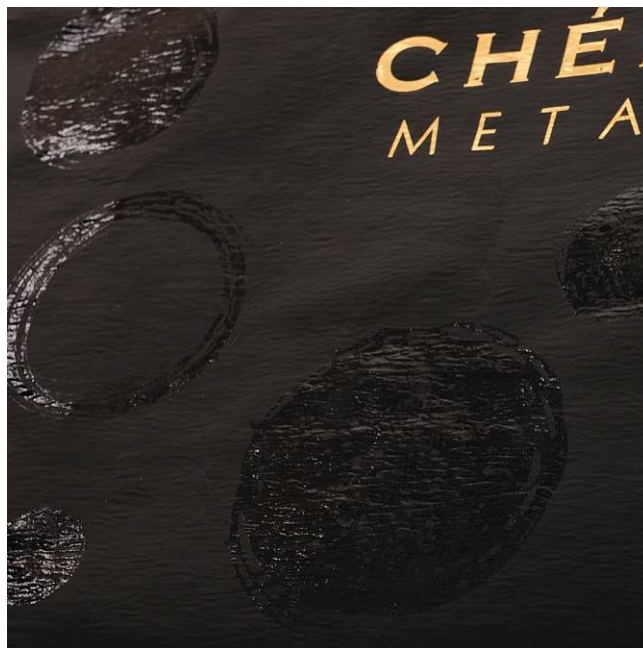
partieller Druck mit UV-Lack