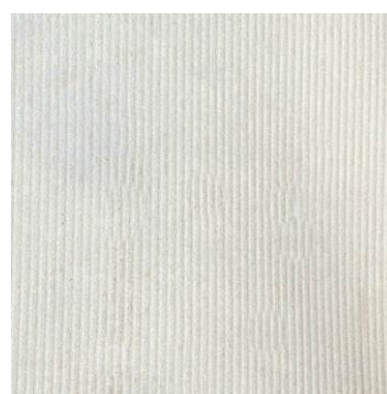
KEC Elastokraft offwhite