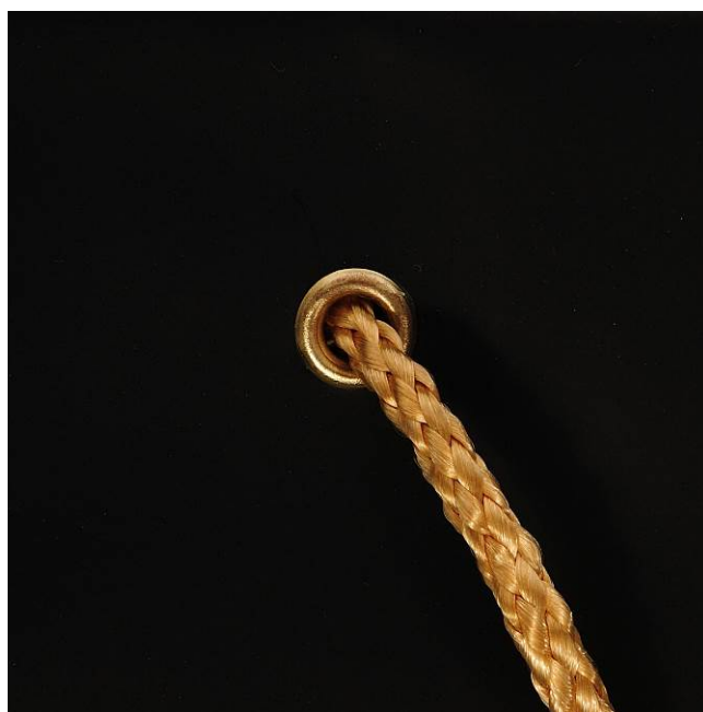
Metall-Öse mit PP-Kordel in gold